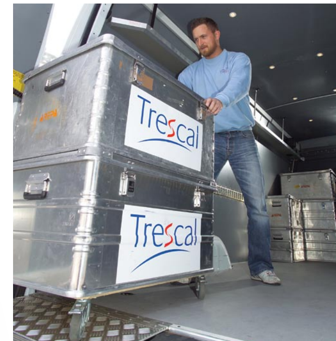
Vi henter og bringer gerne instrumenter i egne opvarmede biler.

Udstrakt, personlig service er en selvfølge. Vores dygtige medarbejdere er klar til at hjælpe døgnet rundt, 365 dage om året. Til daglig tilbyder vi online support på mail eller telefon, og skulle der opstå et akut problem uden for normal åbningstid, er vi aldrig længere væk end telefonen.