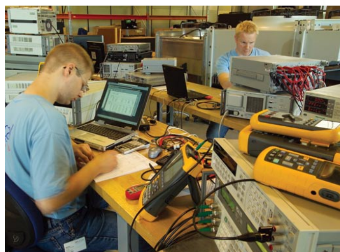
Akkrediteret kalibrering kan foregå i vores speciallaboratorier - eller "on-site" hos kunden.

AREPA T&K var blandt de første laboratorier i landet til at opnå akkreditering af DANAK. Vores akkreditering garanterer ikke alene for sporbarheden til nationale og internationale primærstandarder, men også for at alle virksomhedens processer er under en konstant optimering i forhold til de forventninger, vores kunder har til os.